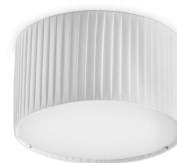
Vorada S N