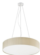
Vorada L C